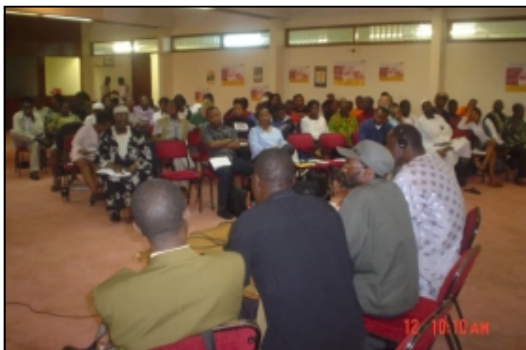
Le panel sur le Nepad et l'Union africaine, hier.