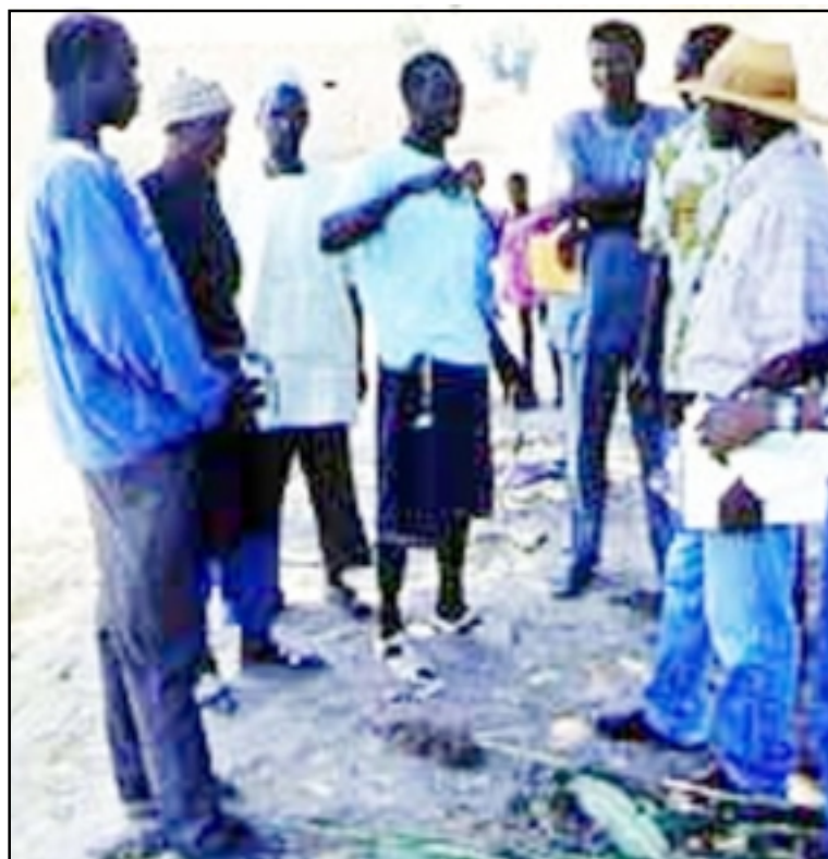
Intervention d'une Ong sur le terrain au Burkina : malgré leur nombre, elles ne pèsent pas encore d'un grand poids sur l'agenda politique burkinabé.

L'État aurait donc eu du mal à trouver des partenaires représentatifs et solides dans cette nébuleuse de petits groupements qui fonctionnent souvent en circuit quasi fermé. Avec leurs codes, leur spécialités, leurs réseaux. Et parfois même leur part de malhonnêteté : un pourcentage de moins en moins négligeable d'Ong burkinabés ne sont créés que dans un seul but : récolter des fonds. Toutefois, il existe au Faso une dizaine d'unions d'Ong, au nombre d'une dizaine. Le Secrétariat permanent des organisations non gouvernementales (Spong) reste le plus important et le plus influent de ces regroupements, fédérant plus de